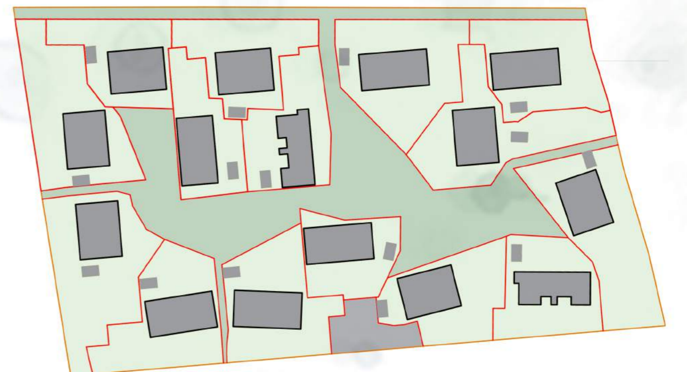
Planeeringuala kruntide struktuur.

Tumerohelisega on toodud avalikult kasutatav ala, helerohelisega elamumaa krunt. Krundipiirid on näidatud oranži joonega.