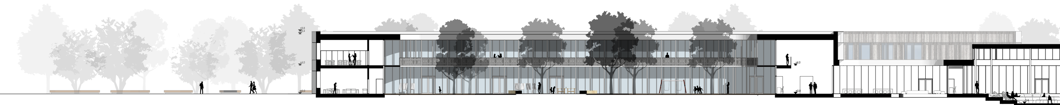
Koolihoone lõige B-B 1:250