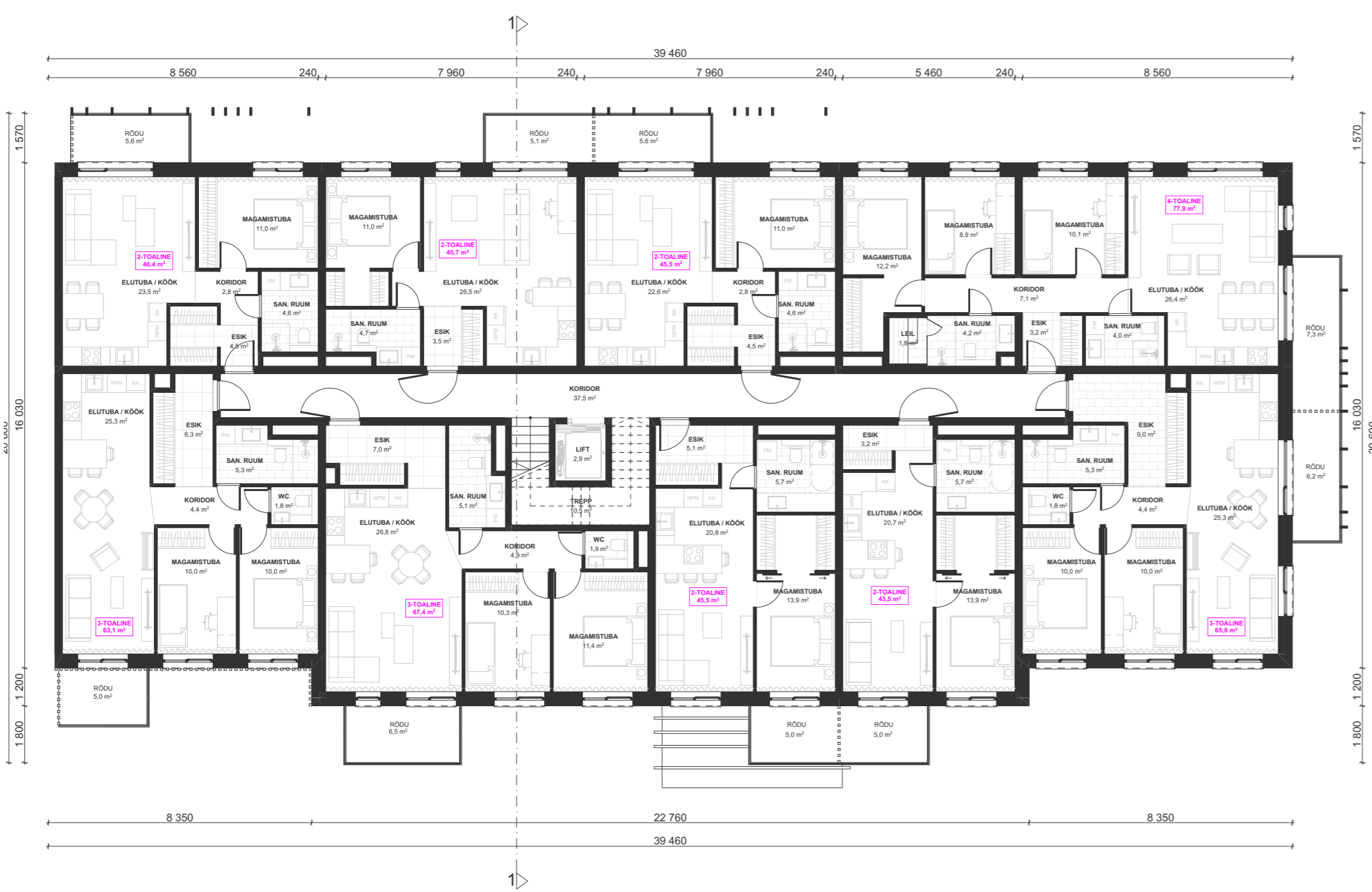
TEISE KUNI NELJANDA KORRUSE PLAAN (KORRUSE BRUTO JA MÜÜDAVANETO SUHE 75,9%)