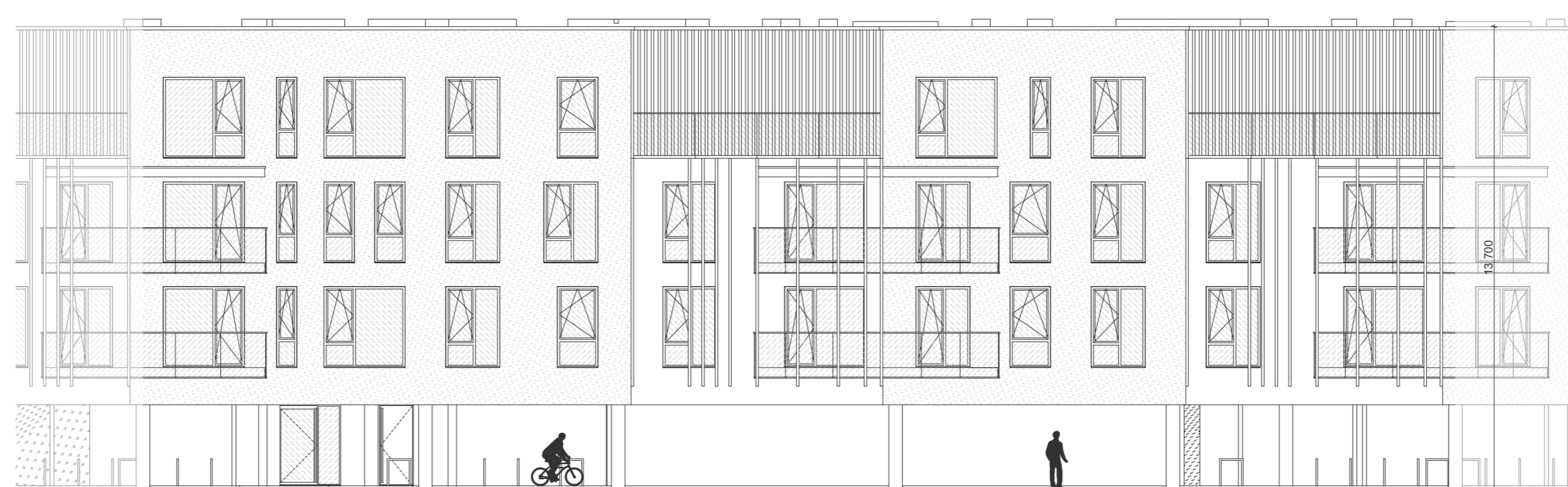
TÜÜP A HOONE MAHT