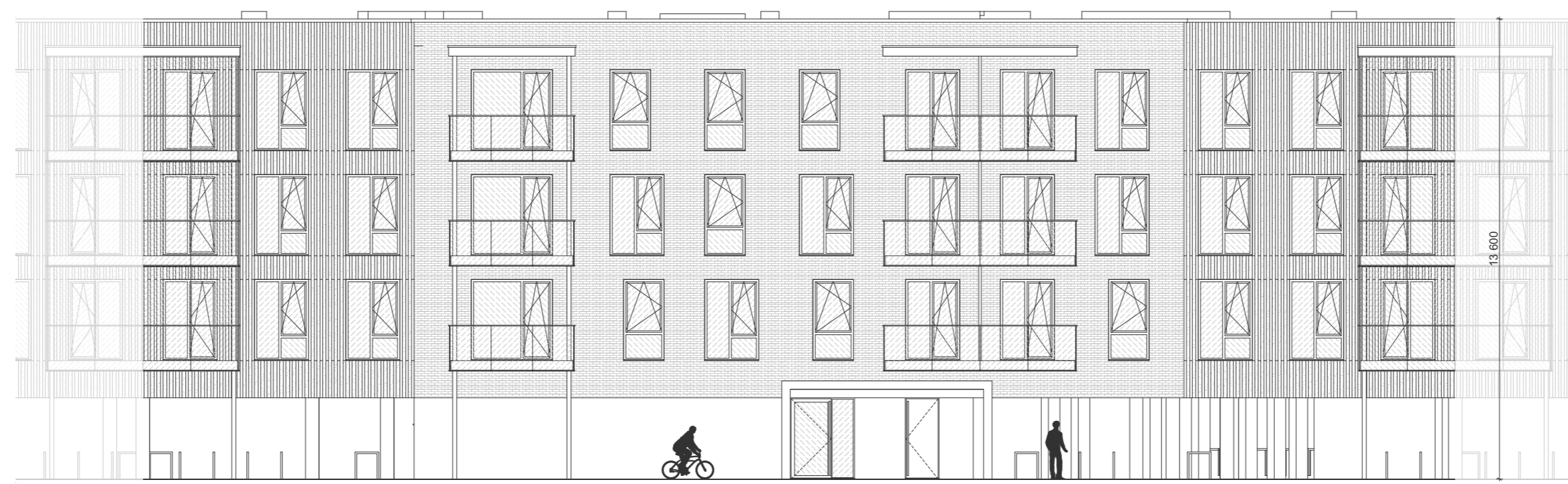
TÜÜP A HOONE MAHT