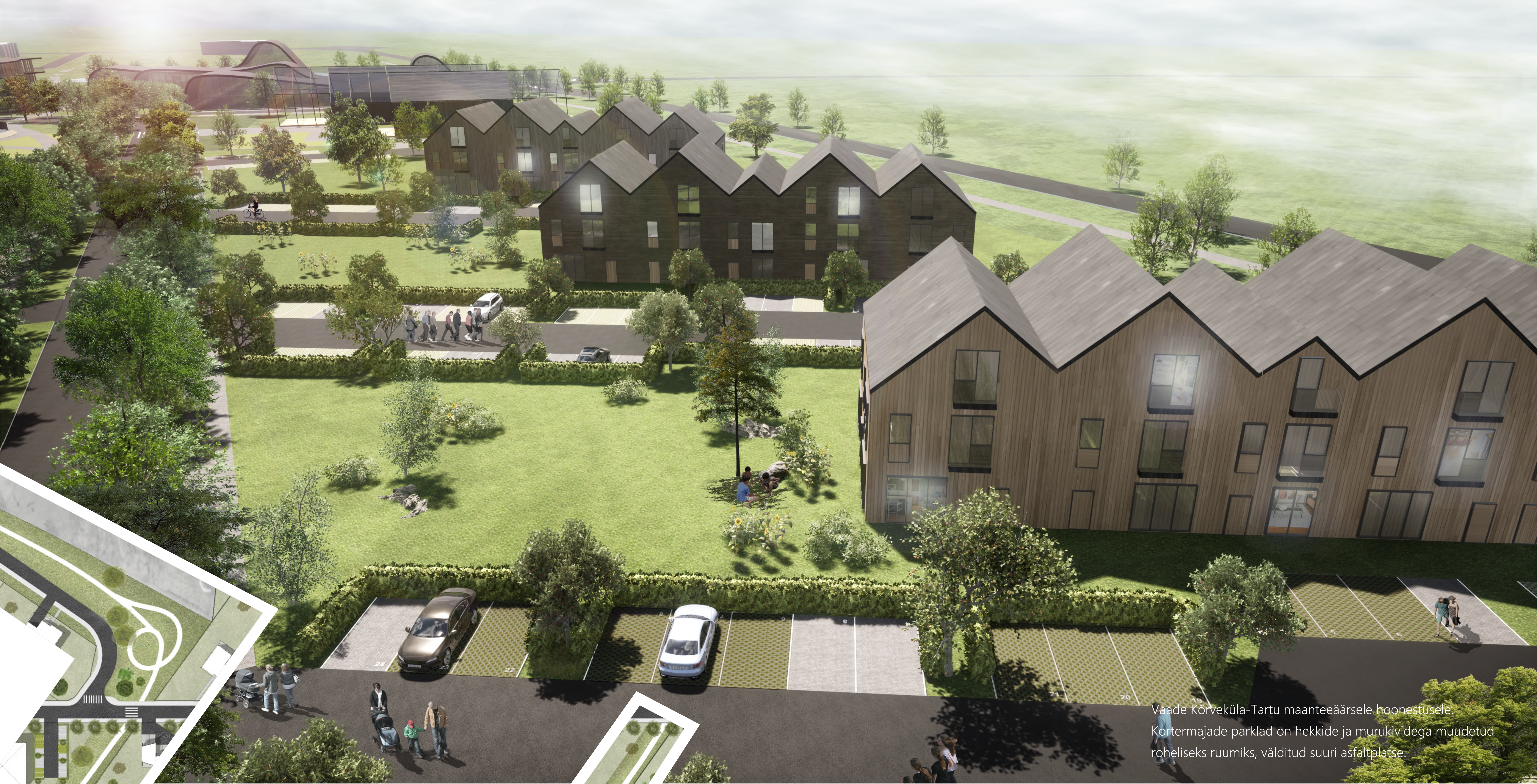
Vaade Kõrveküla-Tartu maanteeäärsele hoonestusele. Kortermajade parklad on hekkide ja murukividega muudetud roheliseks ruumiks, välditud suuri asfaltplatse.