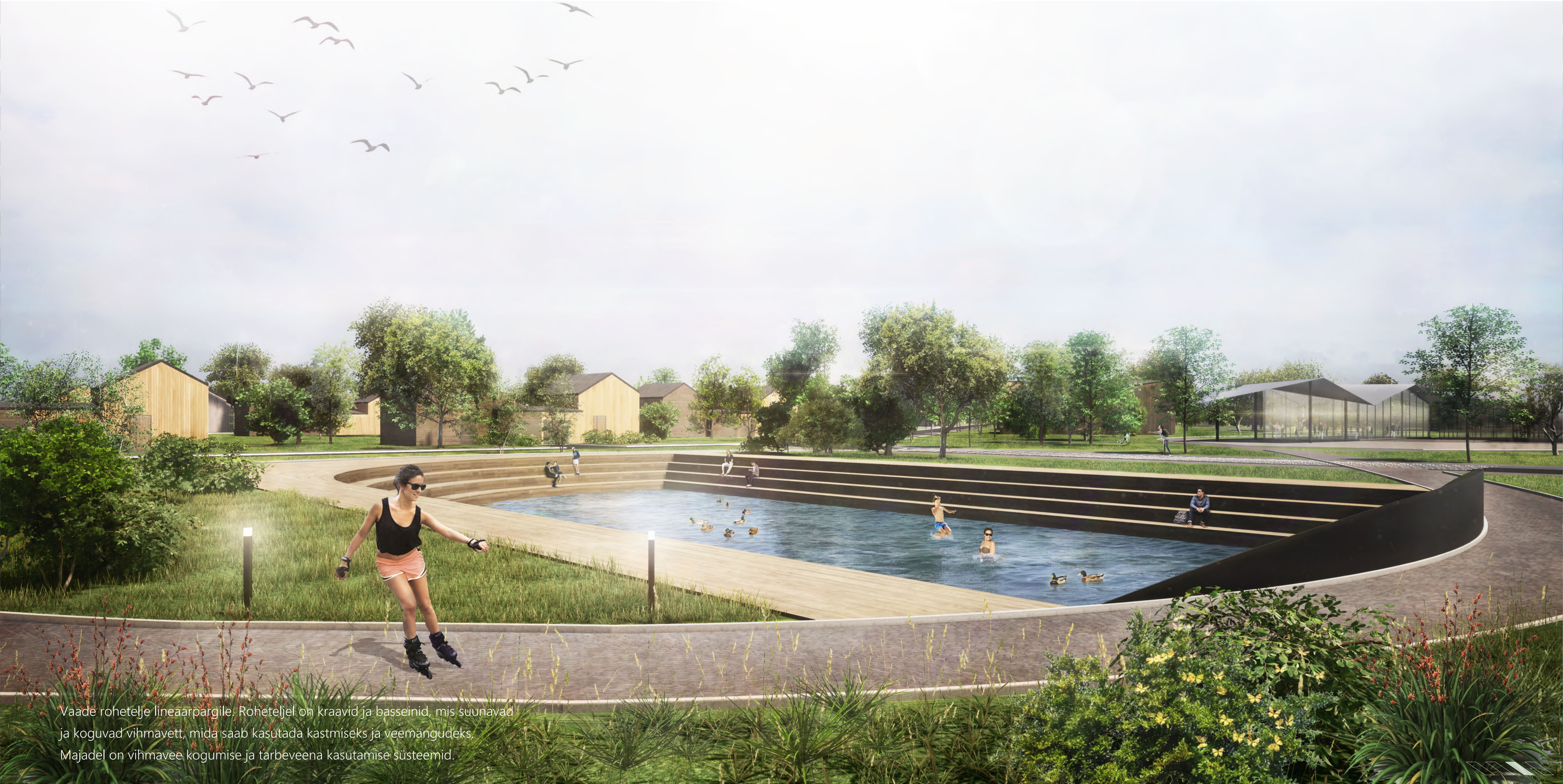
Vaade rohetelje linearpargile. Roheteljel on kraavid ja basseineid, mis suunavad ja koguvad vihmavett, mida saab kasutada kastmiseks ja veemängudeks. Majadel on vihmavee kogumise ja tarbeveena kasutamise süsteemid.

Keskne linearpark on hübriid toidusalust ja aktiivsete tegevustega väliruumist. Park on liigendatud erinevateks osadeks, saluplokid vahelduvad avatamate tegevusaladega. Salud on metsa jälgendavad, mitmerindelised metsatukad: on puid, põõsaid, puhmaid ja rohurinne. Taimede valik on selline, et salu ei oleks vaja väetada, vaid kasutatakse lämmastikus siduvaid, toitaineid ülemistest mullakihtidest ülespoole tõstvaid taimi. Salud on väga liigirikkad, kust saab vilju väga pika aja jooksul aastast – astelpajud, viirpuud, lodjapuud, jõhvikad, jne. Kasutatakse püsilikke, vahepeal silmailu ja tolmeldajate hüvanguks ka üheaastaseid ja isekülitsevaid õitsejaid (päevalilled, saialilled jne). Saludes kasvavad ka õunapuud, pirnipuud, kirsid-ploomid, vaarikad-sõstrad jne. Alumisest rindesse saab rajada nii köögiviljapeenraid kui mitmeaastaste söögitaime kasvukohti (maapirn, rabarber, spargel, mädarõigas). Kindlasti on esindatud kased-vahtrad (kevadine mahl), mesitarud, seemned (austerservikud), ravimtaimed, maitsetaimed. Liigirikas kooslus loob erinevate kasvutingimustega kohti, nii päikselsi kui hämaramaid-niiskeid, kus leiavad kohti väga mitmed erinevad liigid. Kuna salusid ei koristata liigselt (nagu linnapark), vaid pigem harva, saab neist ka nt lõkkematerjali, mida ühistel tuletegemistel kasutada, millest lapsed saavad onne ehitada, sillakesi rajada ja muudeks mängudeks kasutada.