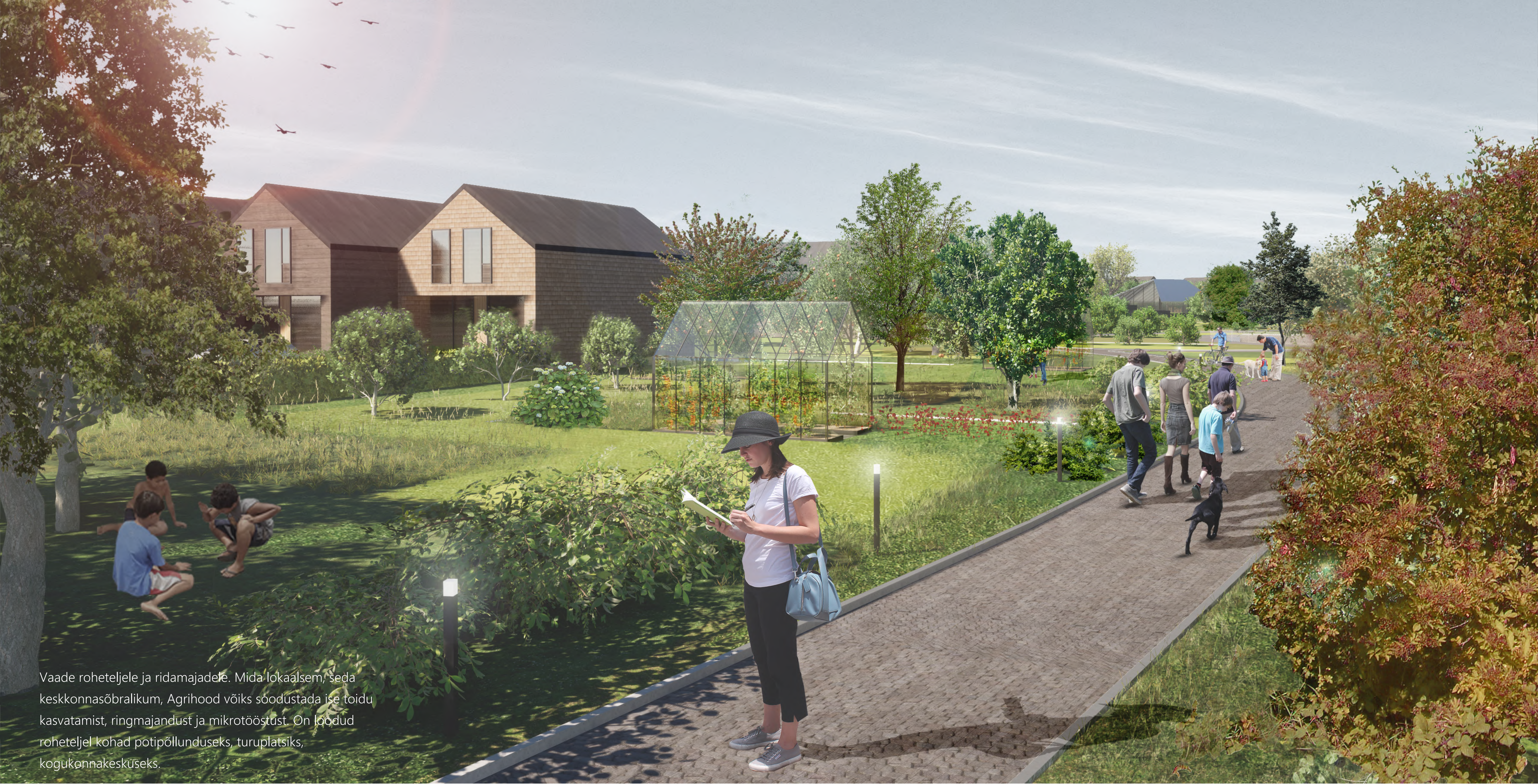
Vaade roheteljele ja ridamajadele. Mida lokaalsem, seda keskkonnasõbralikum, Agrihood võiks soodustada ise toidu kasvatamist, ringmajandust ja mikrotootlust. On loodud roheteljel kohad potipõllunduseks, turuplatsiks, kogukonnakeskuseks.