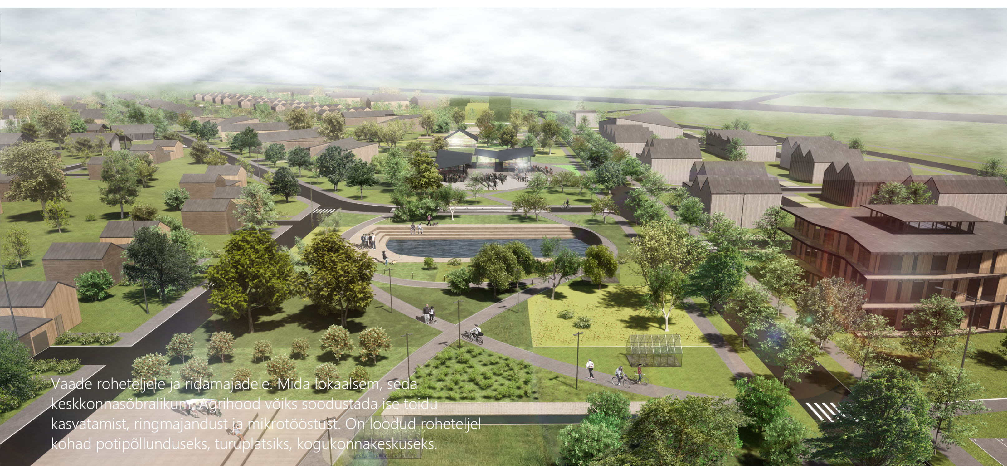
Vaade roheteljele ja ridamajadele. Mida lokaalsem, seda keskkonnasõbralikum, Agrihood võiks soodustada ise toidu kasvatamist, ringmajandust ja mikrotootlust. On loodud roheteljel kohad potipõllunduseks, turuplatsiks, kogukonnakeskuseks.

Keskkonnasõbralik linn on kompaktne ja hästi seotud ühistranspordi ja kergliiklusteede võrgustikuga. Oleme Agrihoodi struktuuri loomisel arvestanud, et see oleks sidus muu linnamustriga.