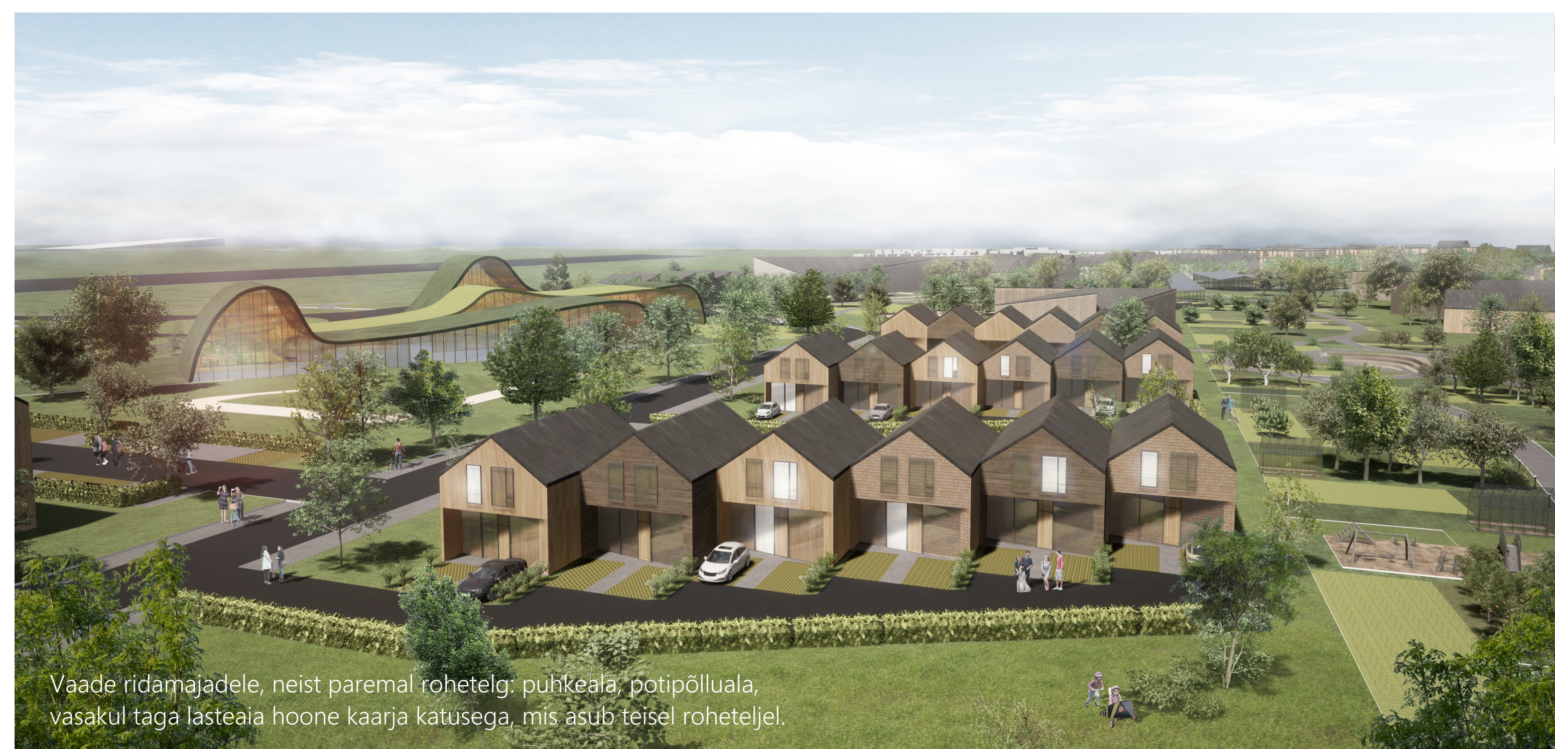
Vaade ridamajadele, neist paremal roheteljel: puhkeala, potipõlluala, vasakul taga lasteaia hoone kaarja katusega, mis asub teisel roheteljel.

Linearpark on justkui Central Park, millega külgnevad kinnistud on hinnalised ja hoonestus joondatud pargipoolsele äärelle. Nii tekib pargi äärde linnalik-aktiivne tänavaruum. Avalikud hooned on roheteljel ja selle ääres, ärihooned ringteega külgnevatel kinnistutel. Kortermajad on vähemalt kolme eri tüüpi: sakilised pulkmajad, mille aknad avanevad ida-lääne suunas, punkthooned, millel on pehmeis rõud ja viilkatustega majade rida. Viilkatuse kasutamine on kui meenusus põllumajandusmüüvikuist - viide kasvuhoonele.