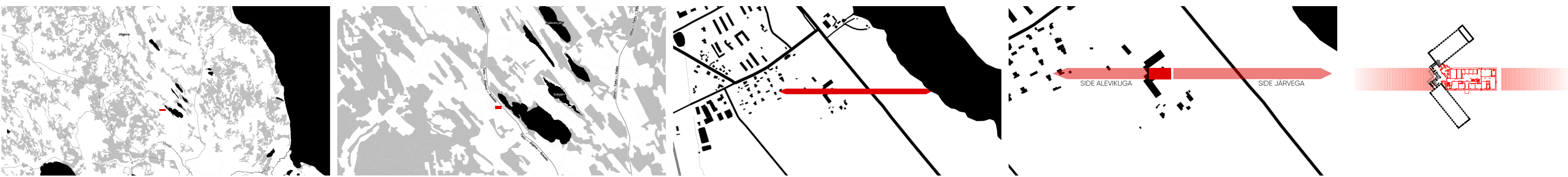
ÜHENDAV JOON TABIVERE ALEVIKU, TARTU-JÕGEVA-ARAVETE MAANTEE JA SAADJÄRVE VAHEL