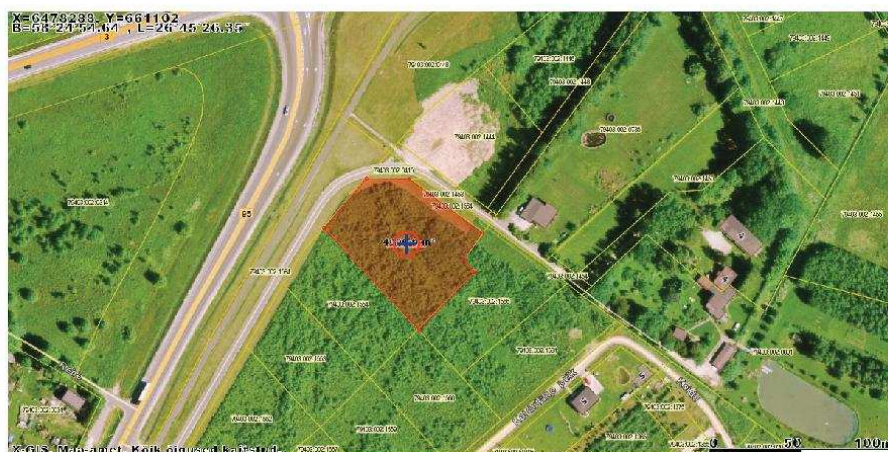
Lisa 1 Planeeritava ala skeem