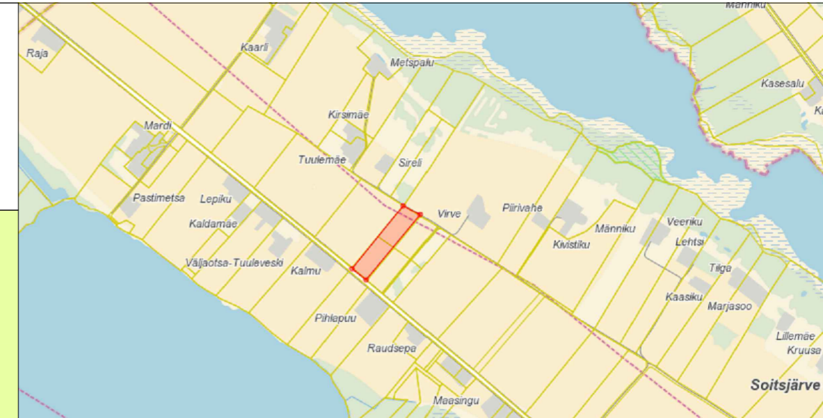
VÄLJAVÕTE MAA-AMETI KAARDIST, planeeringuala tähistatud punase alana.