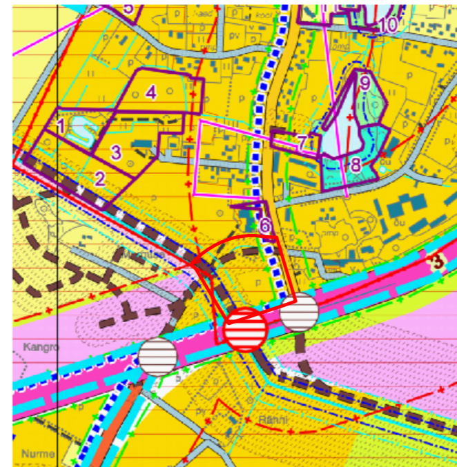
Planeeringuala "C" - keskuse maa