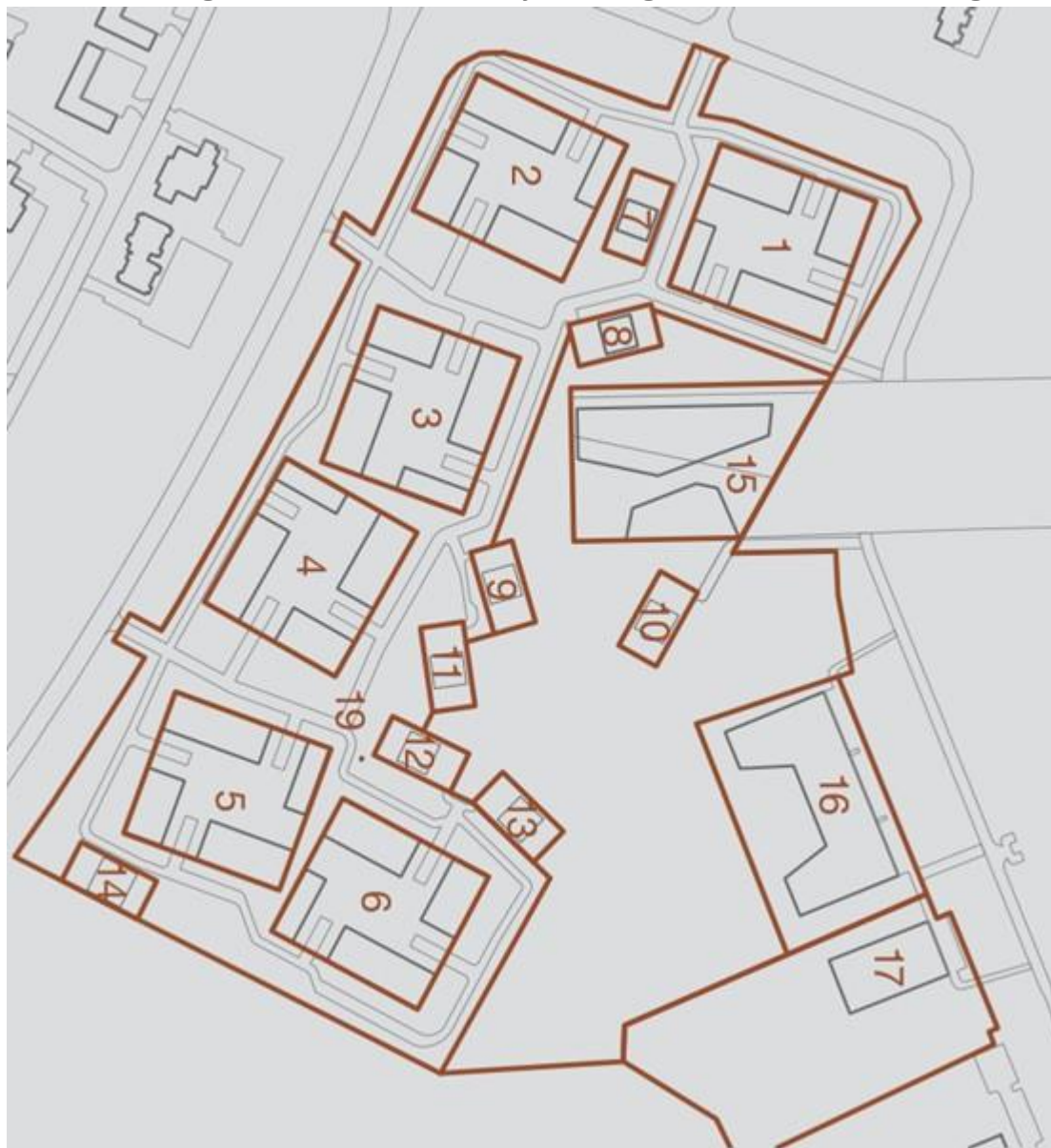
Joonis 4. Esialgne kruntide jaotus (positsioonid) DP algatamise eelses eskiisis.

Tartu vallas Raadi alevis Mõisanurme, Ermi tn 7, Väikepargi, Ermi haljak 4 ja Ermi haljak 5 maaüksuste ning lähiala DP keskkonnamõju strateegilise hindamise eelhindang