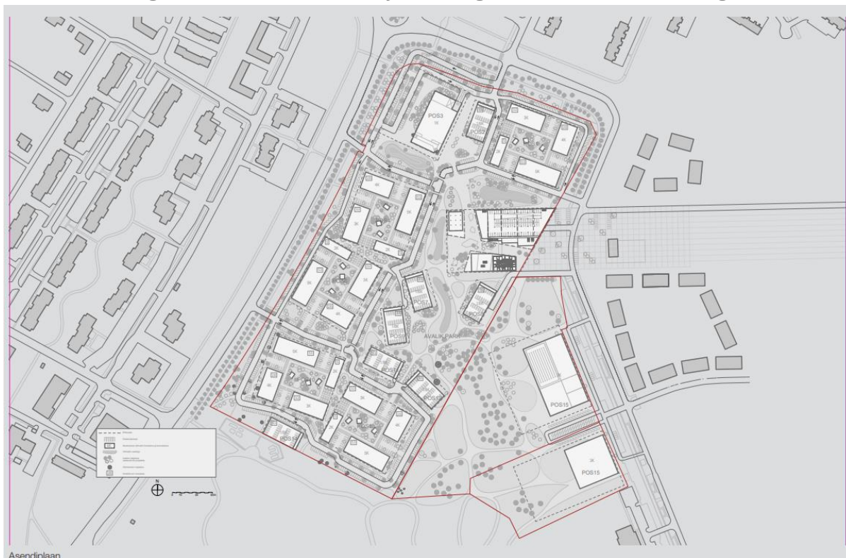
Joonis 2. Väljavõte DP eskiislahendusest.

Tartu vallas Raadi alevis Mõisanurme, Ermi tn 7, Väikepargi, Ermi haljak 4 ja Ermi haljak 5 maaüksuste ning lähiala DP keskkonnamõju strateegilise hindamise eelhindang