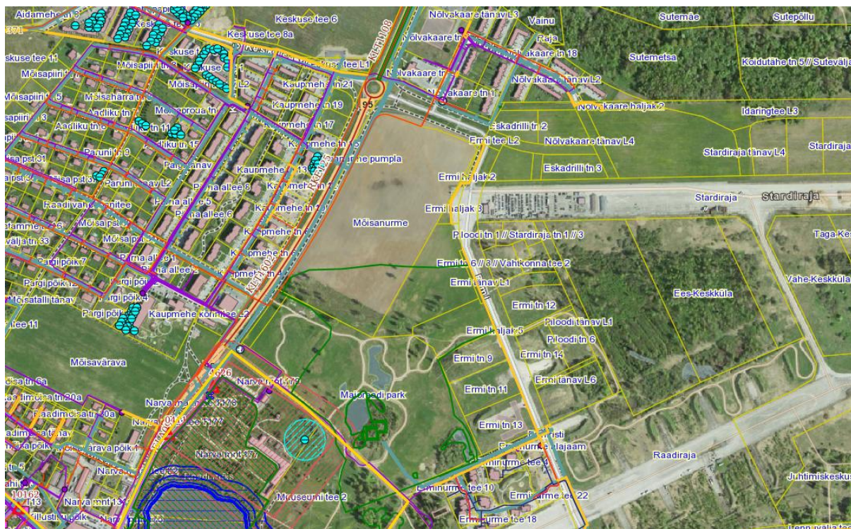
Joonis 6. DP ala asukoht ja kitsendused.

Olulised maakasutuse piirangud ja kitsendused alal puuduvad. DP ala lõunaosale ulatub III kategooria kaitsealuse kahepaikse tiigikonna ( Pelophylax lessonae ) elupaik, EELIS kood KLO9107657 (vt p 5.2).