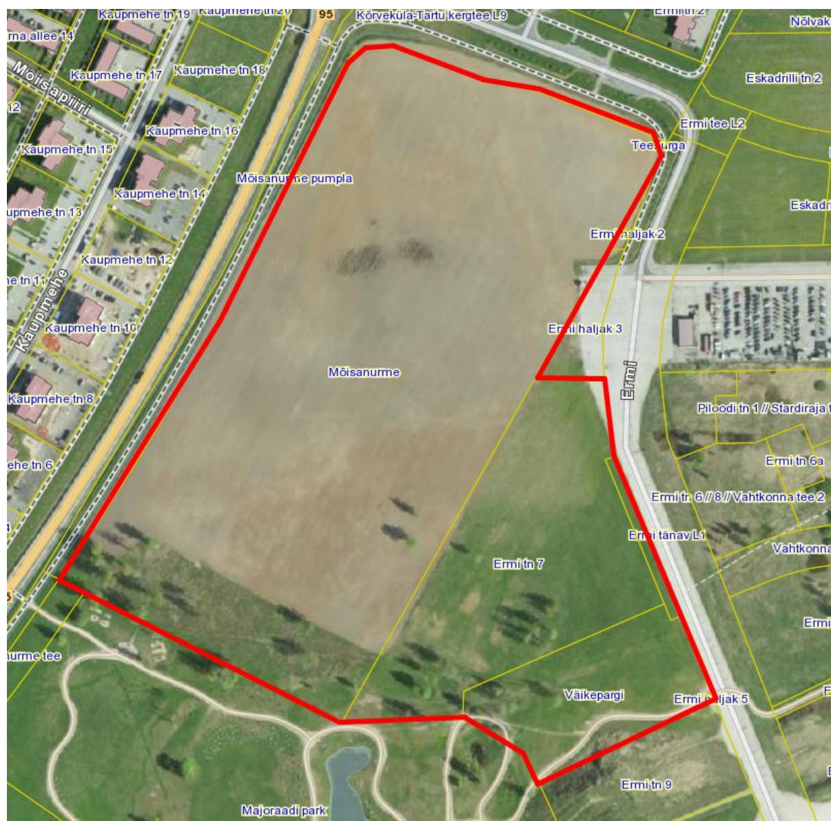
Joonis 1. DP ala.

DP koostamise eesmärgiks on Raadi alevis Mõisanurme maaüksuse ning Ermi tn 7, Väikepargi, Ermi haljak 4 ja Ermi haljak 5 maaüksuste maakasutuse sihtotstarbe muutmine, jagamine korterelamu kruntideks ja kruntidele ehitusõiguse määramine lähtuvalt Mõisanurme planeeringuvõistluse võidutööst. Lisaks määratakse tehnovõrkude asukohad, haljastuse ja heakorrastuse põhimõtted, liikluskorralduse ja servituutide vajadus jms planeerimisseaduses loetletud asjakohased DP ülesanded.