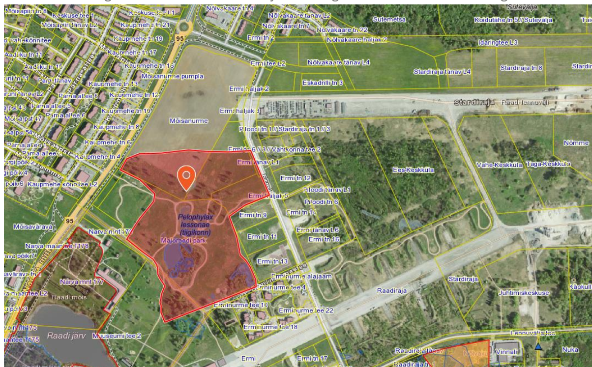
Joonis 7. DP ala asukoht tiigikonna jt liikide elupaikade suhtes.