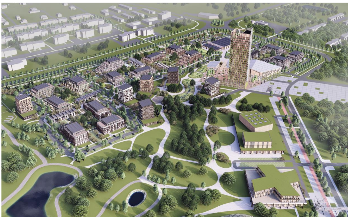
Joonis 3. Väljavõte võidutööst.