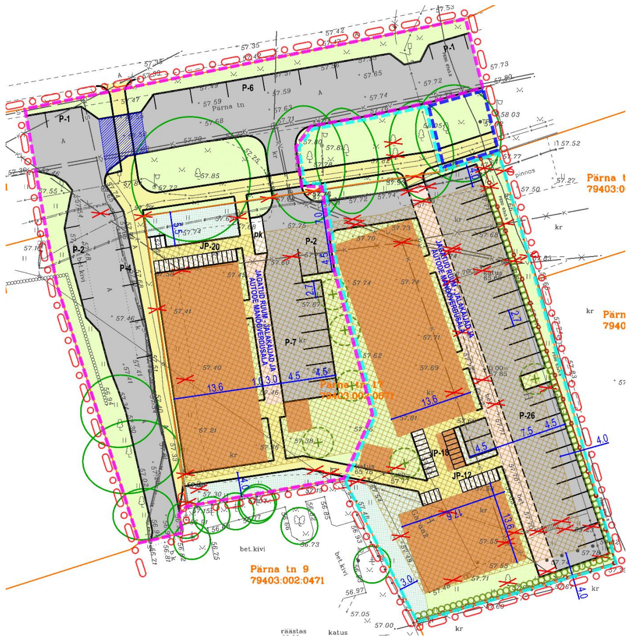
Skeem 4. Võimalik esimese ehitusetapi ala on tähistatud lilla kriipsjoonega; teise ehitusetapi ala on tähistatud helesinise kriipsjoonega; kõnnitee rajamine planeeringualast ida suunas kõnnitee ehitamise korral on tähistatud tumesinise kriipsjoonega.