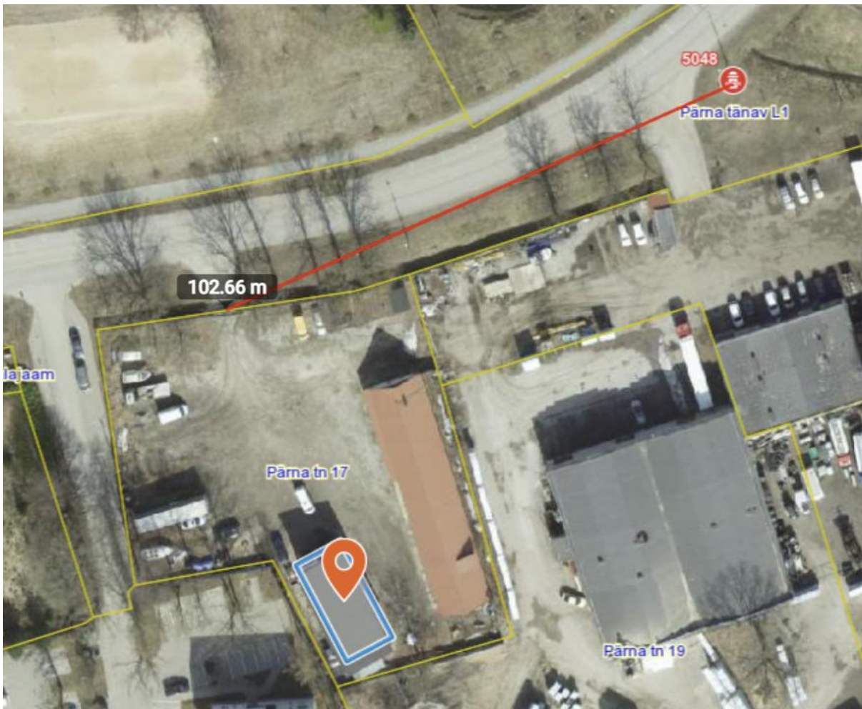
Skeem 2. Olemasoleva hüdrandi nr 5048 asukoht (alus: Maa-ameti kaardirakendus „Ohtlikud käitised, veevarustus, veeohutus“).