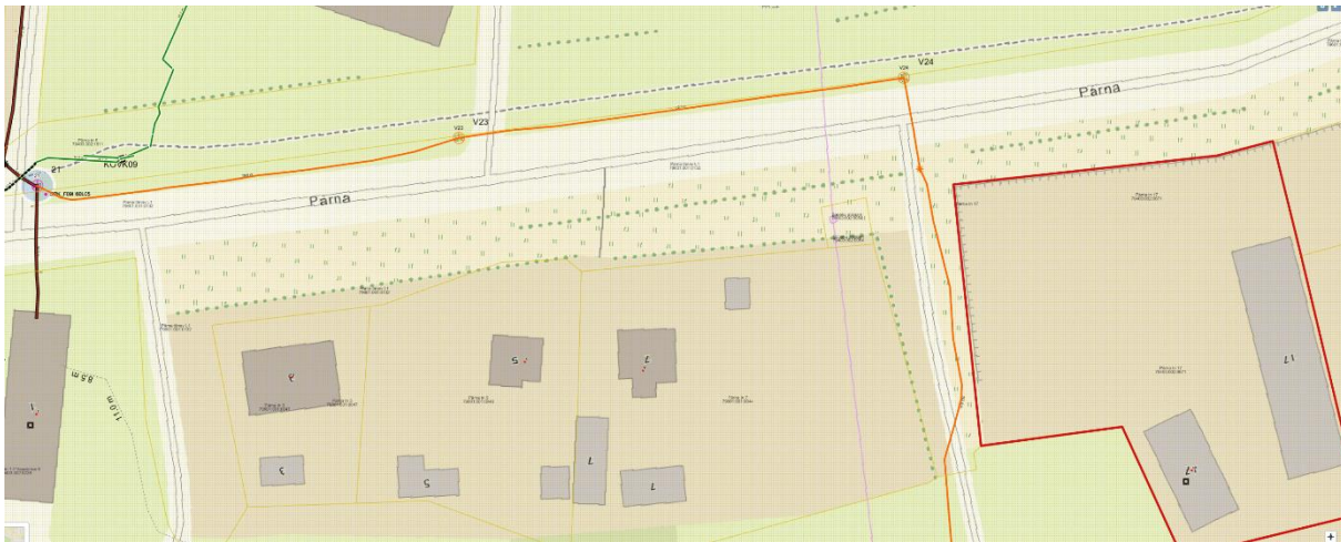
Skeem 3. Olemasoleva telekommunikatsioonivõrgu skeem.

ette KKS tüüpi sidekaevude asukohad ning sidekaevust paigaldada igale hoonele multitorustiku eraldi sisend kuni hoone andmesidejaotlani.