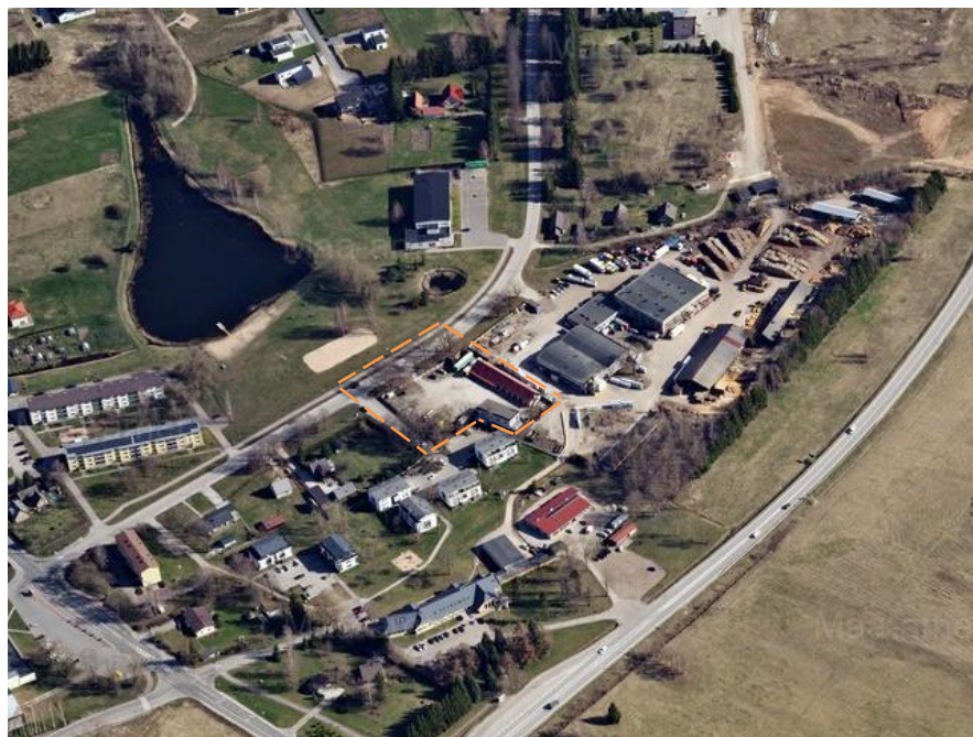
Maa-ameti kaldaerofoto 20.04.2023